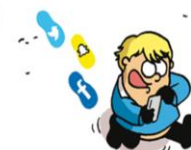
Les bonnes utilisations des réseaux sociaux